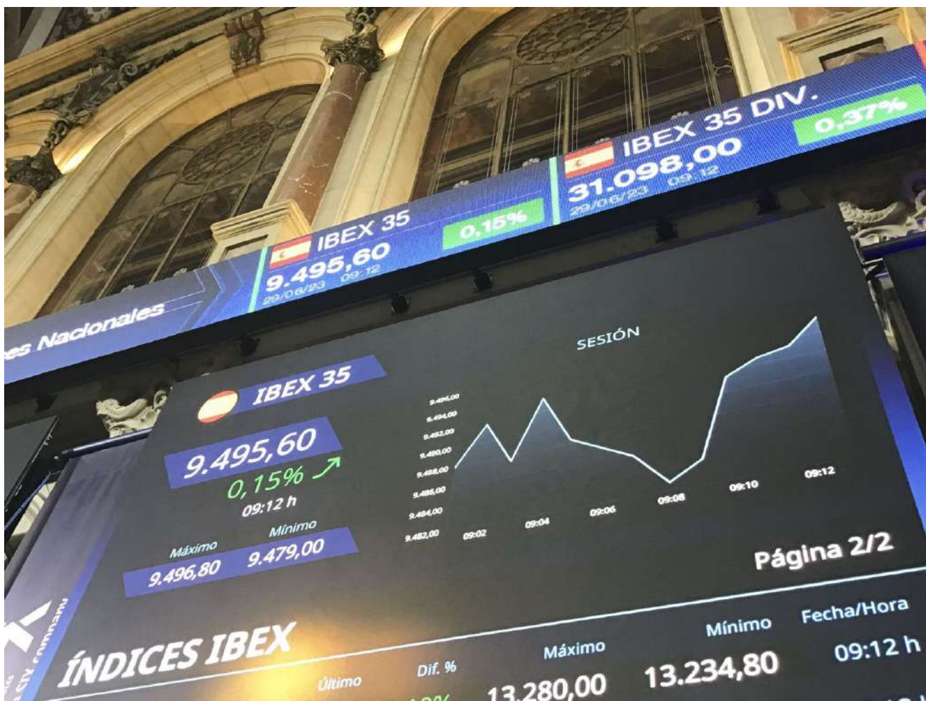
Parqué de la Bolsa.

La banca española abre ronda de resultados en positivo pese a un año de turbulencias en el sector. Bankinter ya ha dado el pistoletazo de salida y la próxima semana presentará el resto